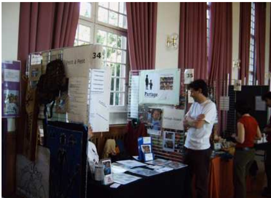
Dans le Hall du pavillon Joséphine lors du forum humani-terre

Contact avec le groupe des Kiwanis de Molsheim. Et aussi plusieurs journées d'agréables rencontres bricolage pour préparer des objets pour la vente.